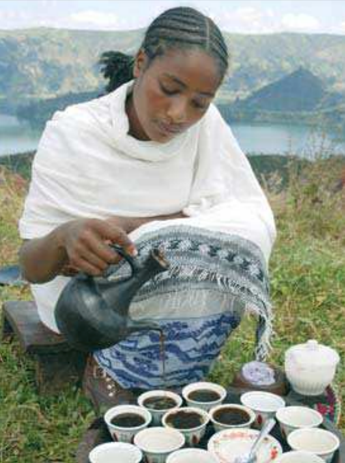
Traditionelle Zeremonie: Frische Kaffeebohnen werden überm Feuer geröstet, zerstampft und mit Quellwasser überbrüht.